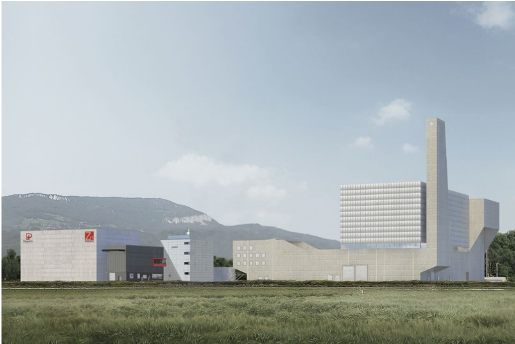
Visualisierung der Anlagen, die am Standort Emmenspitz geplant sind: neue Kehrrechtverwertungsanlage KEBAG mit Phos4Life- und SwissZinc-Anlagen

Im Emmenspitz haben der Zweckverband der Abwasserregion Solothurn-Emme (ZASE) und die KEBAG ihren Sitz. 2023 soll dort das SwissZinc-Verfahren zur schweizweiten Metallrückgewinnung aus Rückständen der Kehrrechtverwertungsanlagen seinen Betrieb aufnehmen und jährlich etwa 2000 Tonnen hochreines Zinkmetall produzieren. Kernstück des Verfahrens ist die Solventextraktion, welche auch im Phos4Life-Verfahren ein zentrales Element ist. Das Know-how dazu stammt in beiden Fällen vom spanischen Generalunternehmer Técnicas Reunidas SA in Madrid.