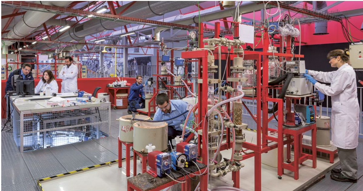
Teilansicht der Pilotanlage beim Technologieanbieter Técnicas Reunidas, José Lladó Technology Centre, Madrid.

Die positiven Resultate bestätigen die vorangegangenen Laborphasen. Aus Zürcher Klärschlammmasche vom Klärwerk Werdhölzli konnte Phosphor mit einer Ausbeute von über 95% in technisch reine Phosphorsäure überführt werden.