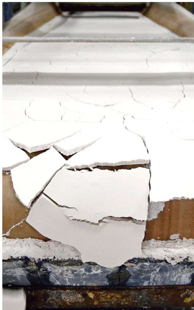
Filtration des Phosphorprodukts