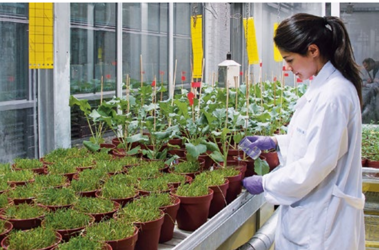
Arbeit im Gewächshaus der ETH Zürich