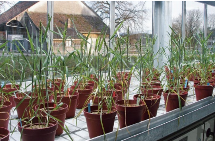
Sommerweizen (1 kg Boden pro Topf)