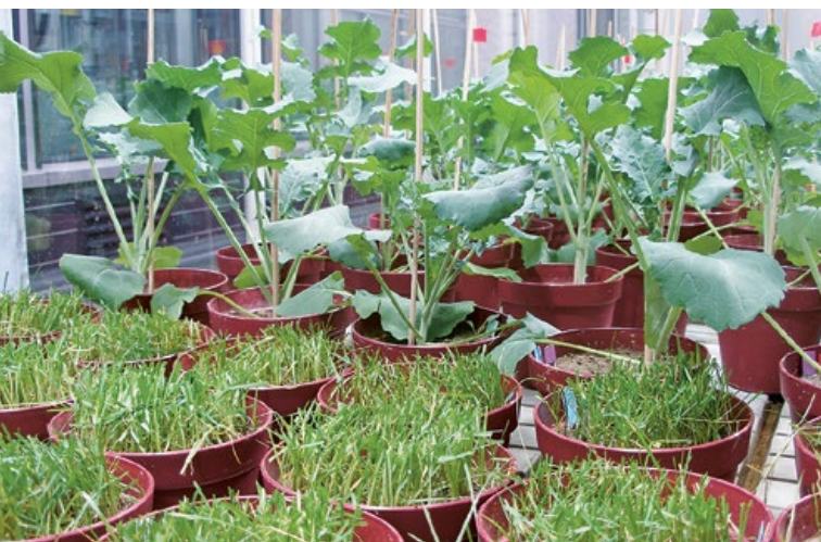
Italienisches Raigras und Raps (1 kg Boden pro Topf)

Tabelle rechts: Exemplarisch für alle gewählten Kulturen sind die Resultate für italienisches Raigras, Sommerraps und Silomais dargestellt. Schwach saurer Boden (Boden A), schwach alkalischer Boden (Boden B) und alkalischer Boden (Boden C). Zahlen in Klammern entsprechen der Standardabweichung von vier Versuchsreplikaten.